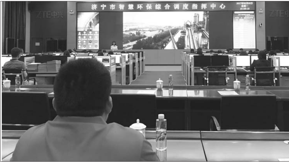
济宁市智慧环保综合调度指挥中心的先进设施。

本报济宁6月5日讯(记者 贾凌煜 通讯员 岳岗) 5日是第46个世界环境日，济宁市环保局邀请人大代表、政协委员、社区群众、媒体记者参观济宁智慧环保调度指挥平台，见证智慧环保的威力。在指挥中心，可通过线上实时监控和在线监督系统，实时查看排污情况。