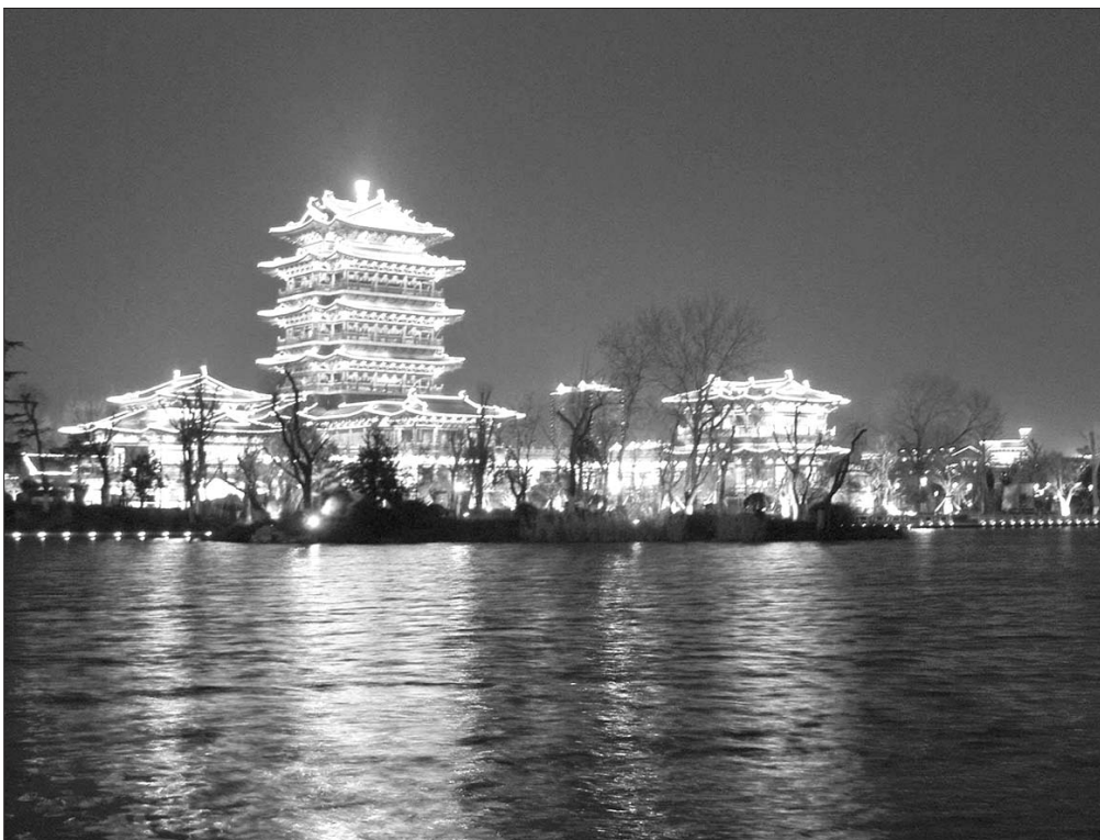
济南大明湖夜景。(资料图)

近日,记者从济南市规划局获悉,“泉城夜宴”由北京清华同衡规划院和济南市勘察测绘研究院承担规划编制任务,还特别