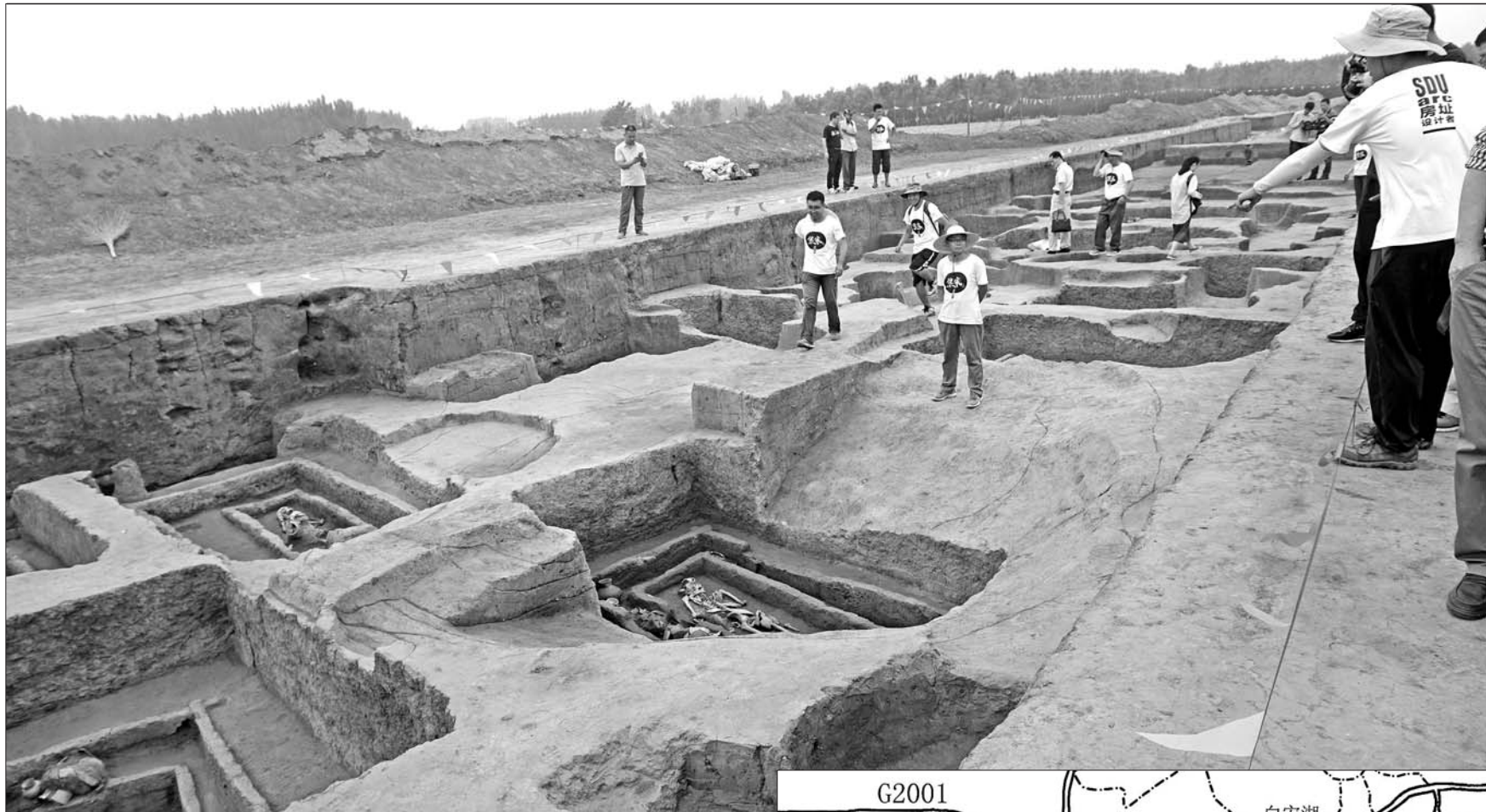
章丘焦家遗址现场。