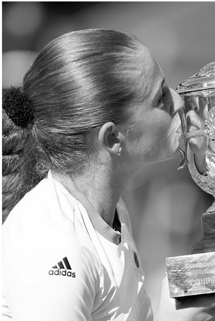
奥斯塔彭科捧起法网冠军奖杯,我们更期待这位天才少女为女子网坛注入新的活力。

如果在法网女单决赛之前提起奥斯塔彭科你会想起什么?或许大多数球迷什么都想不起来。而现在,再次提起她的名字的时候,你要想起的是2017年的法网女单冠军,一位女子网坛等待已久的年仅20岁的大满贯冠军。