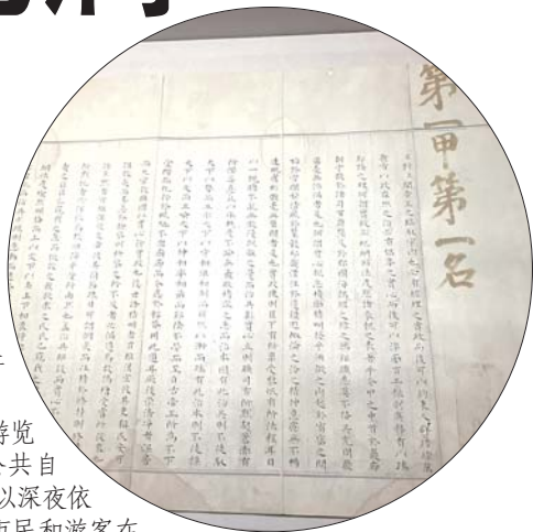
▲明朝万历年间的状元卷。

诸城古称密州,市内有座超然台,始建于北宋年间,大文豪苏轼知密州期间扩建,他修葺北台以登高望远,吟诗作赋,其弟苏辙引用老子“虽有荣观,燕处超然”为其取名“超然台”,苏轼曾作《超然台记》,大家所熟悉的《水调歌头·明月几时有》就是苏轼在超然台赏月饮酒时所作,苏轼知密州期间,勤政爱