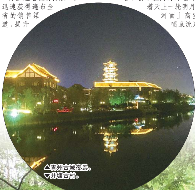
△青州古城夜景。 ▽井塘古村。