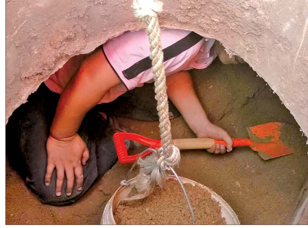
井口太低,工作人员只能跪着干。

涉及了120项维修任务,每天都有大量的工作需要完成,因此同事们很少休假,有时甚至要加班加点工作。近期根据天气情况,开展了“突击周”活动,每天早晨6:30每个工作人员到餐厅吃饭,7:00进入工地,晚上7:30才能下班。同事们工作强度太大,“让兄弟们吃好喝好玩好”成了庞庆飞的“小目标”。前不久,庞庆飞也和同事们举办了篮球赛,供热中心的工作人员积极参与。“也不能老是工作,适当放松一下还是很有必要的。”庞庆飞说。 他提到,如果遇到恶劣天气,他和同事们会在会议室开会学习,互相分享经验。此外,活动室里的空调已经安装完成,接下来如果遇到高温天气,不适合户外作业,工作人员将在活动室内学习专业知识。“我们现在与济南热力成功合作,我们就踏上了发展的快车道,必须各个方面严格要求自己,这样才能保证供暖工作的平稳运行。”