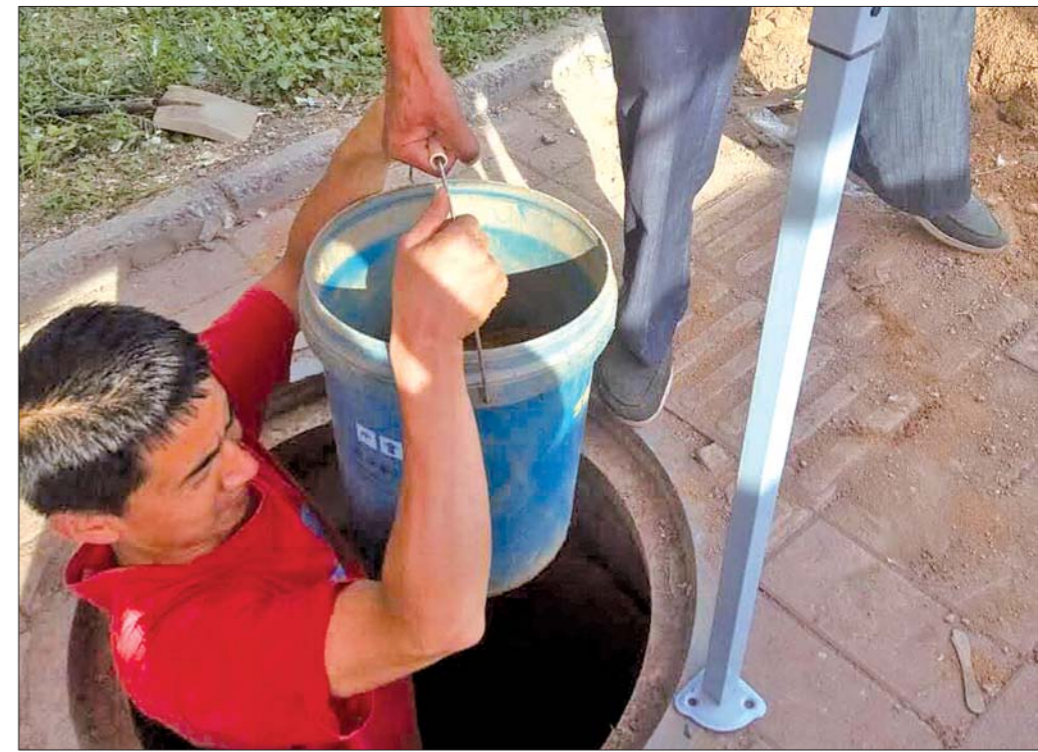
黄沙靠工人一桶一桶挖出来。