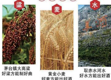
茅台镇大高粱好梁方能制好曲 黄金小麦好麦方能出好酒 取赤水河水好水方能出好酒