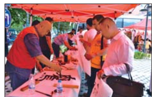
书法家挥毫泼墨,赠与献血者。

样的理念,无偿献血行为被赋予了闪耀着人性光辉的崇高内涵,无偿献血者也受到社会的普遍推崇与尊重。今年活动的主题是“我能做什么”,口号为“献血,现在献血,经常献血”,强调每一个人在紧急情况下的作用,即通过献出宝贵的血液礼物来帮助别人,还强调,定期献血十分重要,这样在紧急情况出现之前就已有足够的血液储备。