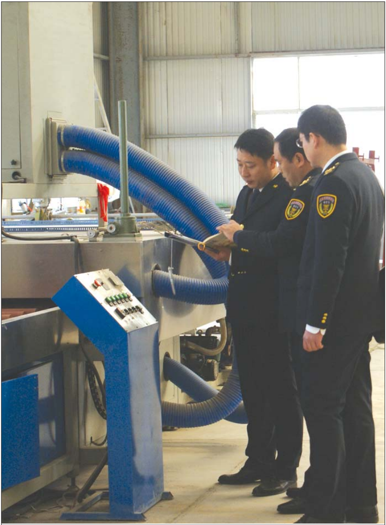
开展钢化玻璃强制性产品认证执法检查。

泰安市市县两级财政对获得山东名牌、山东服务名牌、市长质量奖的单位给予10万元的一次性奖励,对获得市长质量奖的个人给予5万元的一次性奖励。对主持或参与标准制修订、通过试点(示范)项目评估验收,成立标准化技术委员会的企事业单位给予一次性奖励。