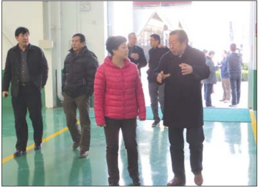
泰安市质监局组织开展市长质量奖现场评审。