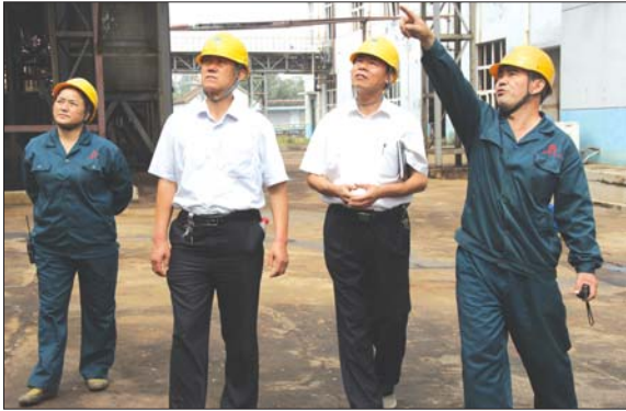
检查化工生产企业关键工序控制。