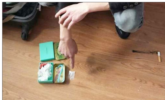
吸毒人员被民警抓获。

滨海公安机关坚持专案经营、合成打击,建立多警种联合打击毒品犯罪工作机制,连续破获特大系列贩毒案,共抓获毒品犯罪嫌疑人68名,缴获冰毒8.7公斤,枪支3支,子弹5发,运毒车辆4部,成功摧毁了3个特大跨省贩毒网络。