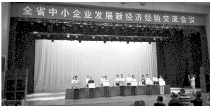
会上推出了100家山东省中小企业发展新经济示范单位。

本报潍坊6月21日讯(记者 马绍栋)21日,全省中小企业发展新经济经验交流会在潍坊召开。会议贯彻落实山东省第十一次党代会精神,总结交流全省中小企业发展新经济的经验和做法,研究部署发展新经济,推进新旧动能转换的工作措施。会上推出了山东省中小企业发展新经济示范单位100家,并为山东省中小企业工业云平台揭牌。会议要求争取用三至五年时间,中小企业新经济发展形成气候,重点领域形成规模,专精特新形成趋势。