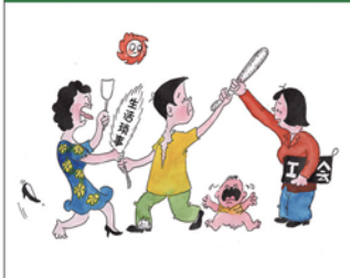
望闻问切安全薄弱人物排查处理法 三十一类安全薄弱人画像之六