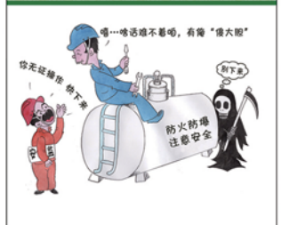
望闻问切安全薄弱人物排查处理法 三十一类安全薄弱人画像之十五