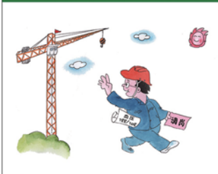
望闻问切安全薄弱人物排查处理法 三十一类安全薄弱人画像之十