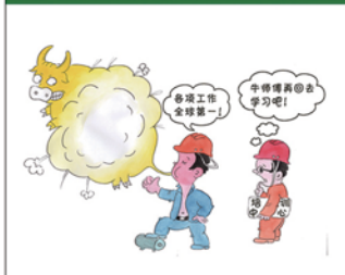
望闻问切安全薄弱人物排查处理法 三十一类安全薄弱人画像之十四