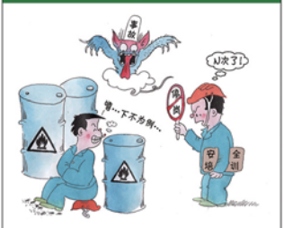
望闻问切安全薄弱人物排查处理法 三十一类安全薄弱人画像之十一