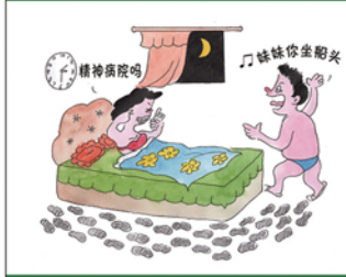
望闻问切安全薄弱人物排查处理法 三十一类安全薄弱人画像之八