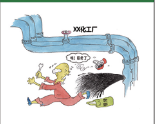
望闻问切安全薄弱人物排查处理法 三十一类安全薄弱人画像之三