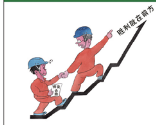
望闻问切安全薄弱人物排查处理法 三十一类安全薄弱人画像之十二