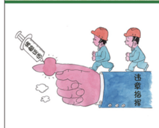
望闻问切安全薄弱人物排查处理法 三十一类安全薄弱人画像之十六