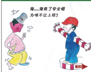
望闻问切安全薄弱人物排查处理法 三十一类安全薄弱人画像之二