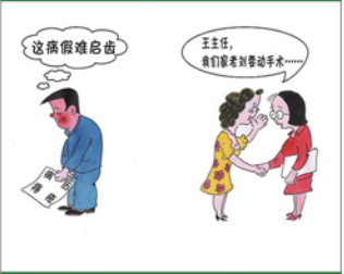
望闻问切安全薄弱人物排查处理法 三十一类安全薄弱人画像之七