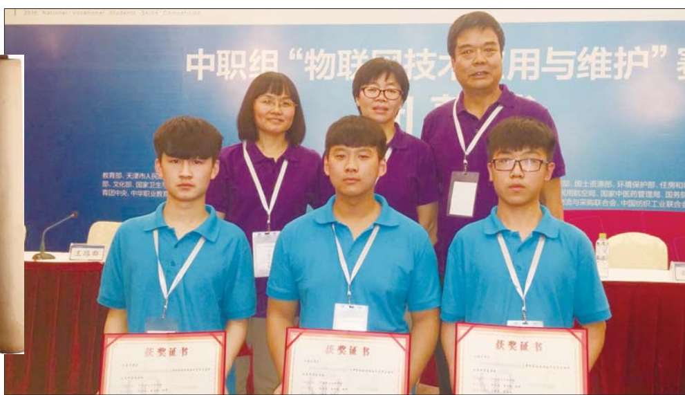
济南信息工程学校技能大赛夺冠

全国职业院校技能大赛“物联网技术应用与维护”比赛设立四年，济南信息工程学校年年摘牌，其中2015年、2016年夺得两连冠。在“计算机硬件检测维护与数据恢复”的国赛中，该校近几年也是接连摘金夺银。技能大赛的参赛不仅仅给学校带来了成绩，促进了学生的成长，更带动了品牌专业的建设。