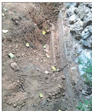
青石的下面露出的两块条石。