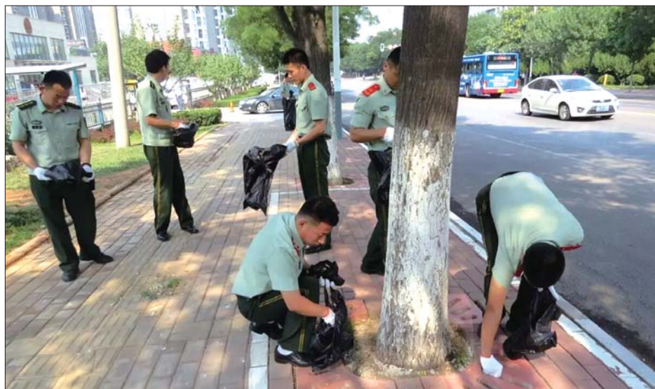
高新区消防大队清理道路垃圾及小广告。