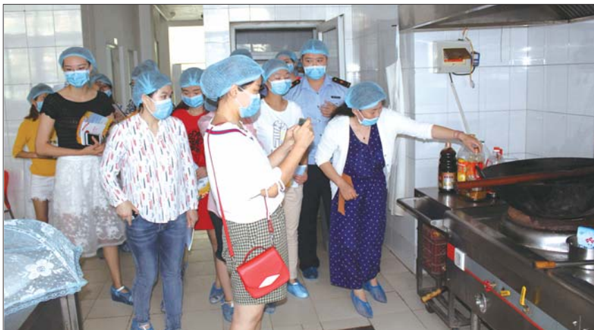
幼儿园食堂开放日,家长了解食堂卫生情况。