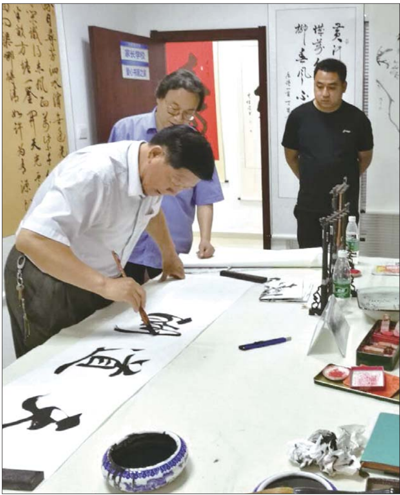
龙奥国际居委会首届社区书画展。

贤文幼儿园负责人表示,幼儿膳食营养工作非常重要,是衡量办园质量的重要标准之一,将继续做好幼儿食品安全工作,进一步提高食堂管理水平,主动接受监管部门和家长的监督。