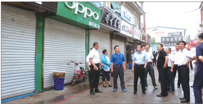
高新区创城督导组对埠东村商业街进行督导检查。

早晨六点左右,正在建设的菠萝山农贸市场内,蔬菜瓜果等摊点早已摆放整齐,虽然下着零星小雨,但业户们还是不慌不乱,有说有笑,秩序井然。新的一天又是一个新的开始。