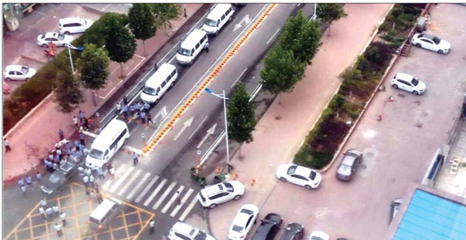
草山岭大集被取缔,道路交通顺畅了。