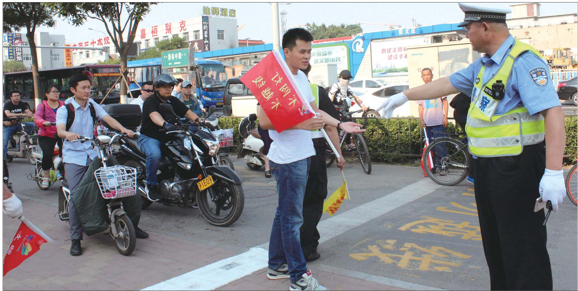
不守交规,小伙被交警查处后打小旗维护路口交通秩序。