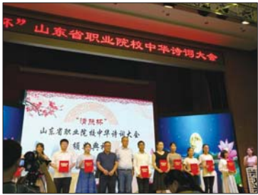
聊城高级财经学校学生领奖。

本报聊城7月2日讯(记者 杨淑君 通讯员 董凤霞 李娟) 近日,由山东省职业技术教育学会主办的“清照杯”山东省职业院校中华诗词大会在济南工程职业技术学院举行。来自全省54所职业院校的100名师生选手参加比赛。