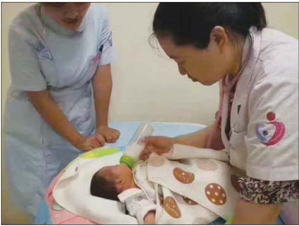
医护人员正在照料被弃女婴。

体异常。”医护人员介绍。 医院护理人员介绍,当晚一同跟随民警来医院的还有一名女士,这名女士是目击证人,是这位女士在闸口运河边发现了这名弃婴,由于担心地上的蚂蚁咬伤这名弃婴,这位好心女士还为女婴进行的简单的护理,随后民警赶到现场,把女婴送到医院。 “好心女士是一位爱心妈妈,她的孩子才四个月大。”医护人员介绍,当时110民警和救助站工作人员都在医院调查,那位好心女士为了照顾女婴,配合警方调查,一直到半夜才离开医院,期间,一直帮着医护人员照顾弃婴。