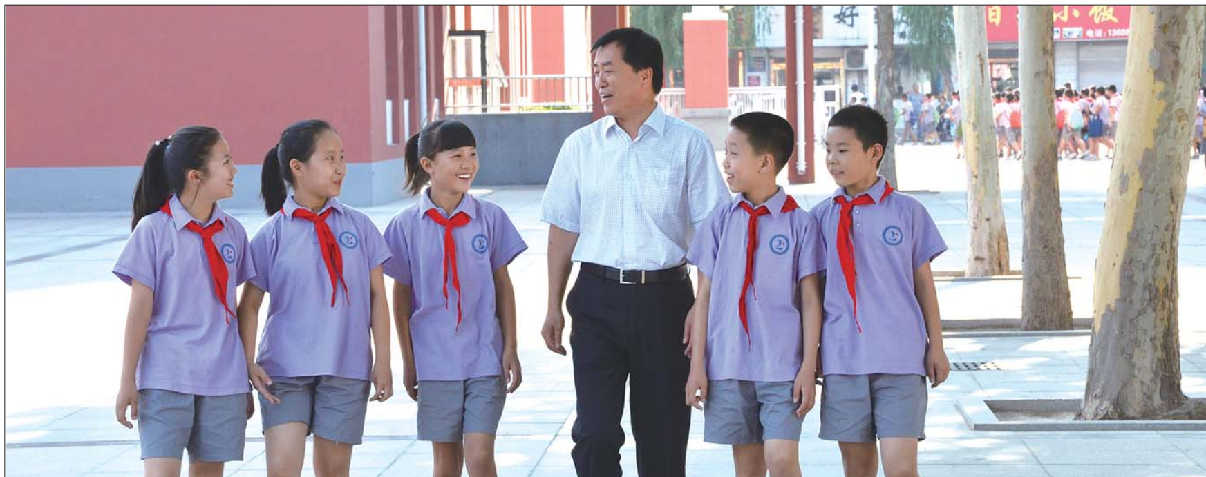
第二实验小学欢迎你

商河县第二实验小学创办于一九九八年,校园占地面积20700平方米,校舍建筑面积13600平方米。学校拥有设备先进的电化教学系统、现代化的校园信息网络、全方位的校园安全监控设备、配备齐全功能完善的专用教室等现代化教育教学设施。近几年来,学校在教育教学改革过程中逐步形成了自己的办学特色——正趣教育!