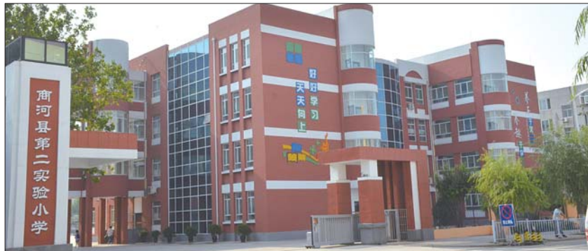
商河县第二实验小学

在“正趣课程”中,利用助学单这一形式,借助于信息技术这一手段,打造小组合作学习这一组织,所实现的终极目标就是全面提高学生素养。“三环五