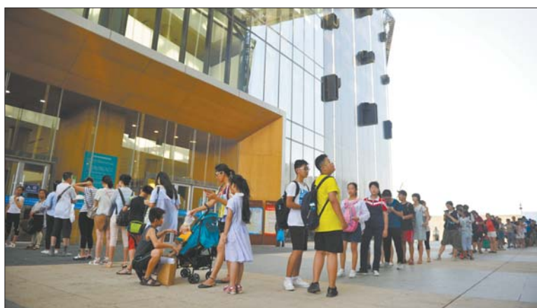
11日上午9点,济南市图书馆新馆开门前,等待进馆的市民排起了长龙,弯弯曲曲的有三四百人。