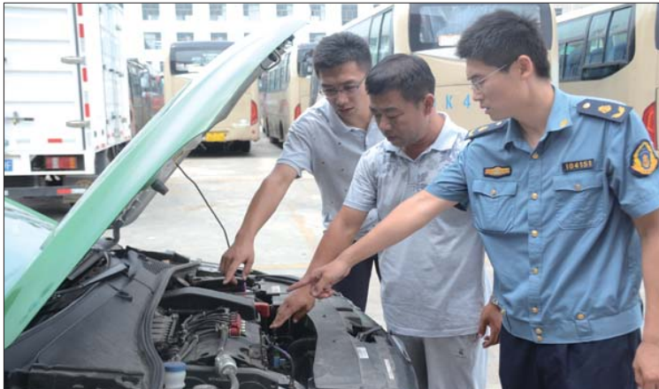
工作人员正在对出租车车辆性能进行检测。

文登区道路运输管理处出租管理部门工作人员介绍,在营运出租车年度审验过程中,车容车貌、标志标识作为今年参审车辆的首检项目,对车辆监督服务电话、门徽标志、驾驶员监督服务卡不在指定位置粘贴摆放,车容车貌脏乱差的,不予对其进行年审。对不符要求的车辆,责令其立即整改,确保为市民提供良好的乘车环境。