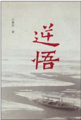
《逆悟》 孔繁轲 著 山东人民出版社

主人公田文是省环保局副处长，被选派到家乡 M 县挂职县委副书记。在面对家乡被污染以致河道淤积、水灾频发，老革命五爷遭受尘肺病，同学彩云惨遭村支书李三胖蹂躏等一切不平时，田文发誓要扳倒那些村里乡里的恶势力。在与村支书李三胖、副乡长刘水、县长赵达等人的斗争中，田文被打了“黑枪”，差点丢了命，终于在县委书记路行等支持下，获得了某种胜利。而另一方面，在田文的原单位，靠着溜须拍马起家的苟处长又一次成功