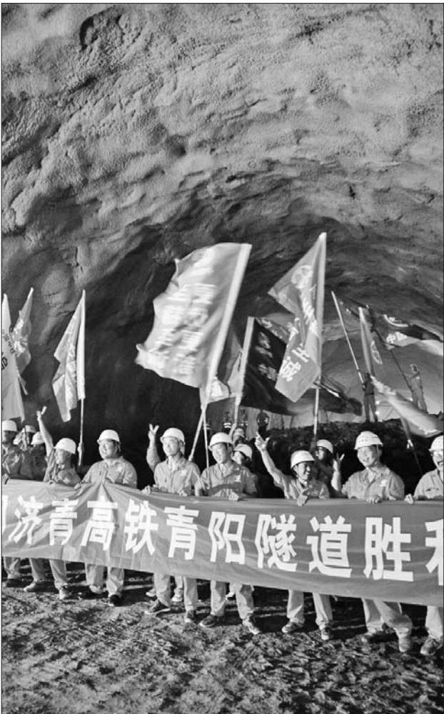
10.1公里长的隧道全线贯通,工人们激动地挥舞着旗帜。

赵湘轶介绍,“免费师范生录取的学生,第一适合干教育,第二乐于干教育。”据了解,去年山师免费师范生报考的人数有3300多人,今年只有2200多人,虽然今年所录取的免费师范生相对去年的人数有所减少,但学生分数的差距明显缩小。