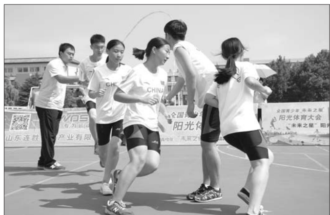
来自全省各地的青少年在欢乐中比赛。

向全省青少年发出运动寄语,她倡议青少年们走向户外,拥抱阳光,在体育锻炼中收获健康,收获快乐,在体育运动中收获友谊,培养团队精神。