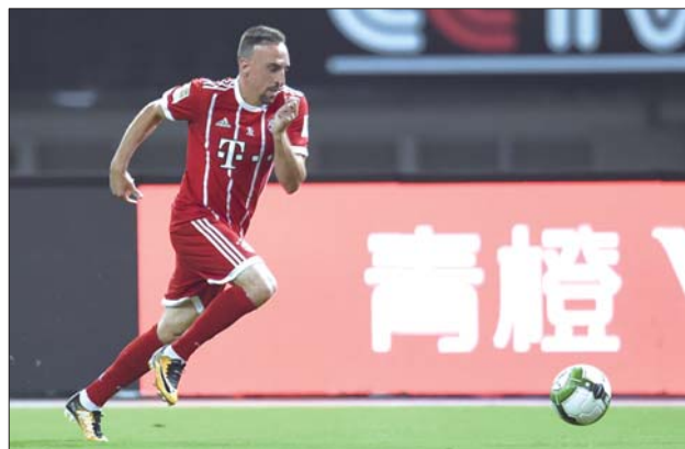
拜仁将在中国的赛场捍卫荣誉。

与多特蒙德的比赛结束之后,AC米兰队包括博努奇、安德烈·席尔瓦在内的几名新援19日来到中国与球队