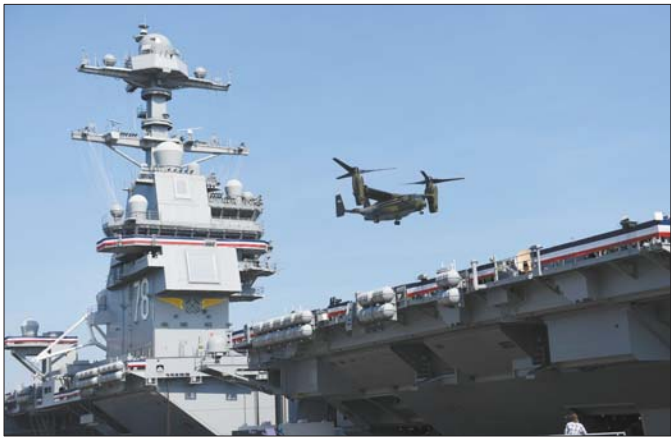
7月22日，在美国弗吉尼亚州诺福克海军基地，一架海军陆战队MV-22B鱼鹰旋翼机降落在“福特”号航母上。