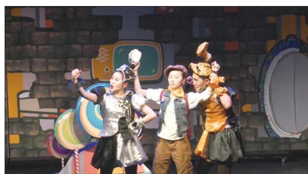
山东文化惠民消费季期间,聊城将奉上一系列惠民演出。

市文广新局工作人员介绍,文化惠民消费季文化项目要求凡在工商行政部门登记注册的各种所有制的具有法人资格的文化企业和文化市场经营户,具体行业范围为(包括但不限于):演艺娱乐、动漫游戏、数字文化、艺术品、传统工艺、艺术培训、文化旅游、文化会展、文化经纪代理、文化产品制造销售、文化创意