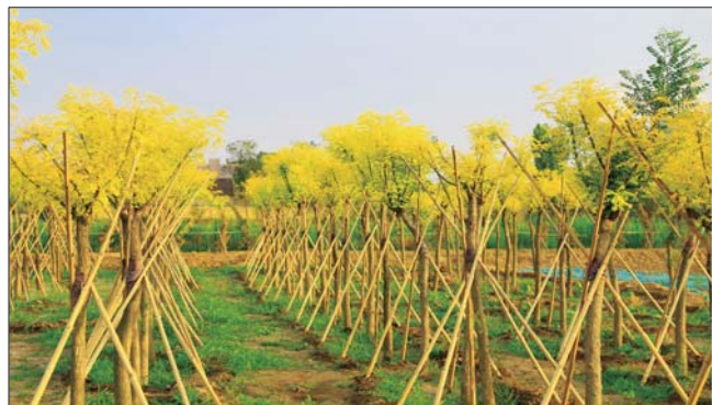
大运河生态林场一角

据运河经济开发区城市管理局绿化办工作人员介绍，此次种植的桃树均是成年桃树，开花后以粉红色为主，日常会有专业的技术人员对树木进行打理，运河两岸绿化提升工程将再次提升运河两岸的生态绿化效果。另外，工作人员提醒，绿化种植完成后有一段时间的养护期，市民在此遛弯休闲时不要践踏草坪，折损桃枝。