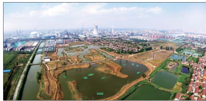
今年3月份开建的西陈沟省级湿地，作为承接消化周边大企业中和废气的缓冲，改善着周边的居住环境。