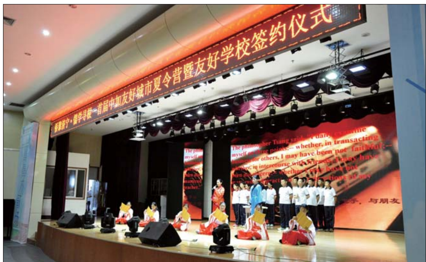
签约仪式后,学生们表演精彩的节目。

本报济宁7月26日讯(记者 姬生辉 汪洸 通讯员 卢红 宋丹) 7月20日下午3点,首届中加友好城市夏令营暨友好学校签约仪式在济宁市实验初中举行。作为济宁市任城区窗口学校的济宁市实验初中,成功接待加拿大友好合作学校代表,并达成友好合作协议,也拉开了校际国际合作的新篇章。