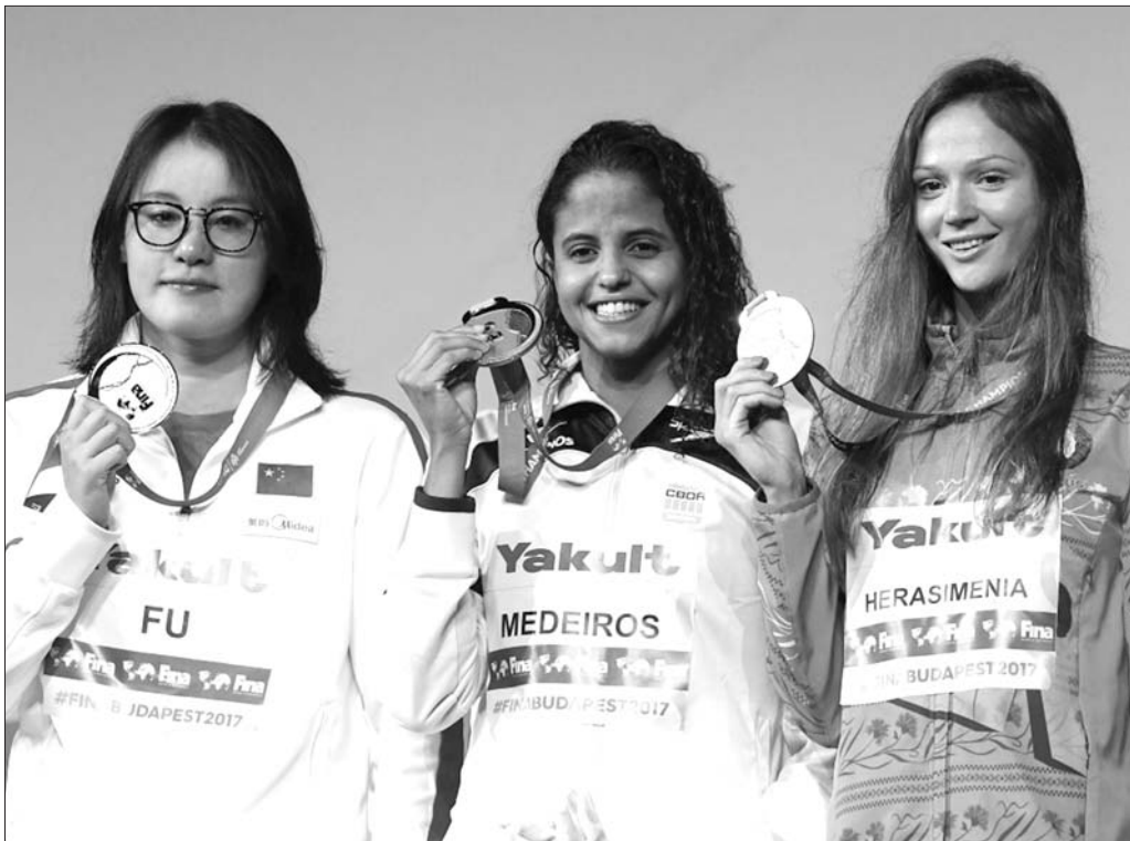
仅仅0.01秒之差,傅园慧获得银牌。

傅园慧哭了,傅园慧又笑了。北京时间28日凌晨,在游泳世锦赛女子50米仰泳决赛中,傅园慧以27秒15获得亚军,仅比冠军慢了0.01秒。领奖台上,傅园慧红着眼眶,她不甘心自己脖子上奖牌的颜色。但平静心情面对镜头,她又成了那个自带“表情包”的快乐女孩。“哭完了就好了呗,把它(比赛失利)当作垃圾一样哭掉,这个世界还是很美好的。”一哭一笑之间,是压力和性情的全部诠释。