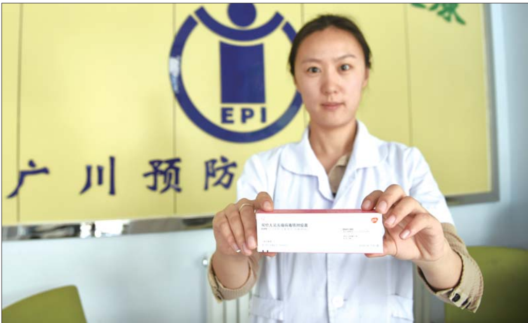
宫颈癌疫苗在德州打出第一针,目前在山东已有9个市到货。

德州打出宫颈癌疫苗第一针后,记者从疫苗厂家获悉,首批宫颈癌疫苗山东到货4900支,德州、淄博、临沂、青岛等9个市都已经完成了采购,并于2日上午到货;其他地市的疫苗也将陆续完成采购并送达。