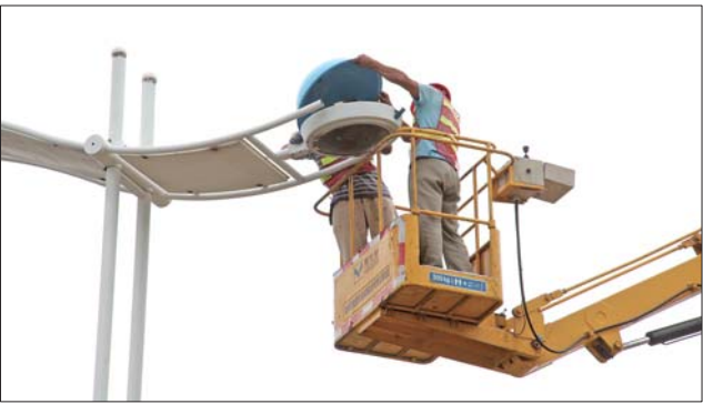
经十东路维修路灯。