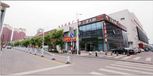
香港街疏通微循环。