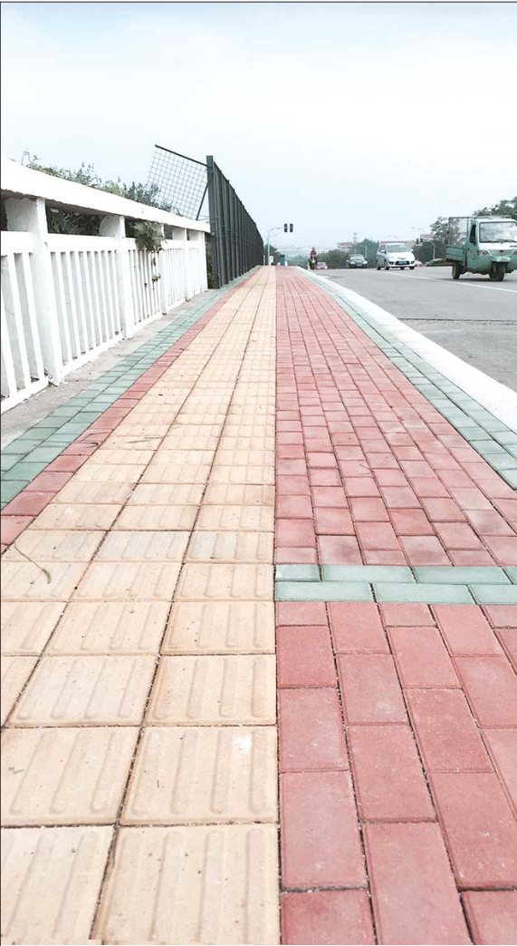
世纪西路人行道整治。