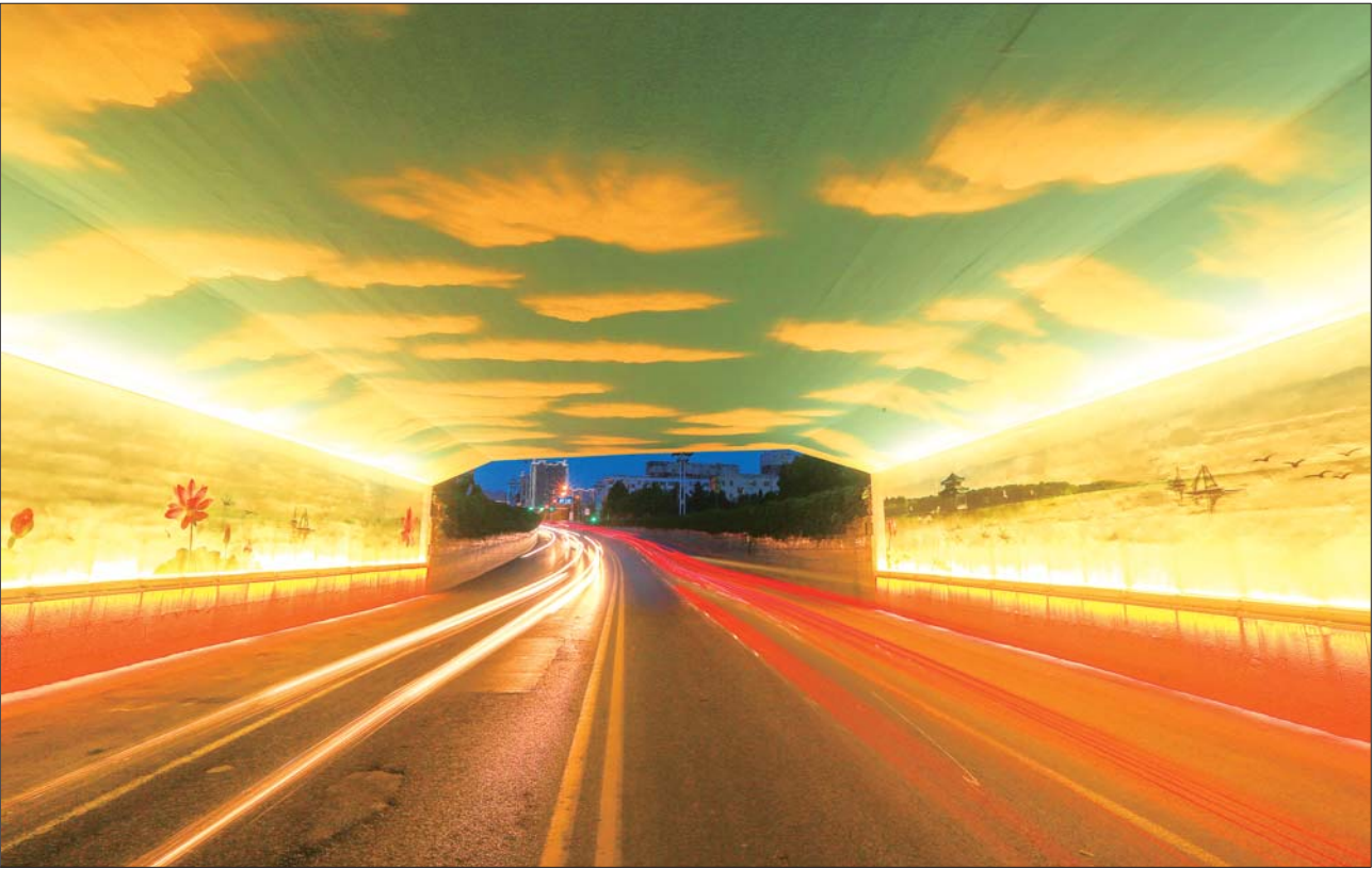
铁路桥涵下,沁人心脾的画卷。

城市公园景区不仅为居民提供了健身娱乐的好去处,也有助于提升城市环境品质。自创城以来,百脉泉公园、眼明泉公园等六大公园景区都进行了提档升级,修缮配套设施、增加保洁频次、加大创城宣传力度,对不文明现象进行整治等,用实际行动为培育和践行社会主义核心价值观、深入推进文明城市创建助力添彩。