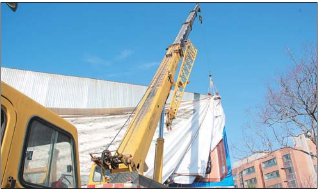
绣水大街拆除大型户外广告。