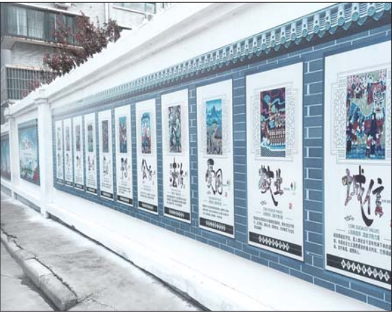
眼明泉小区整治的文化墙。