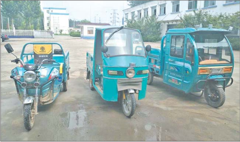
3辆电动三轮车被民警追回。

三轮车刚购买10天被盗。经过民警的侦查，发现作案嫌疑人为同一人。由此，民警扩大范围继续搜找面包车，在其两次作案必经地进行蹲点守候。