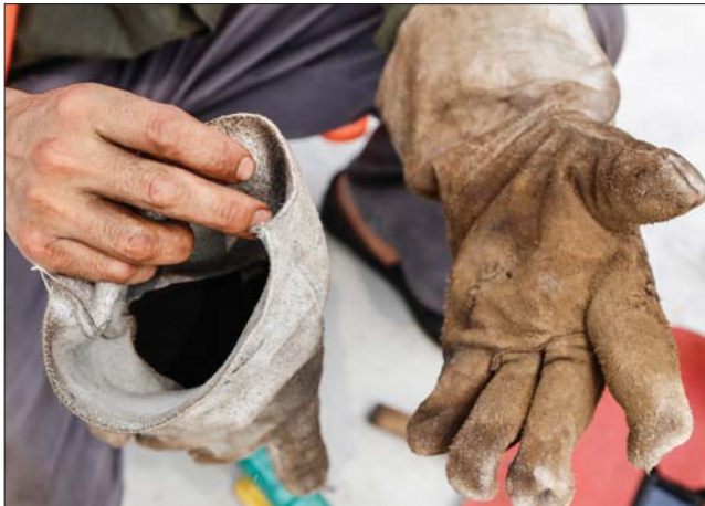
天气炎热,工人们依然带着厚厚的手套工作。