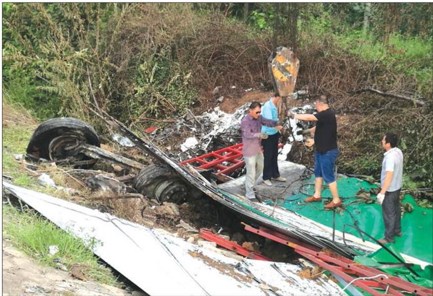
货车已面目全非。

本报泰安8月6日讯(记者 张伟) 8月5日上午9点40分左右，泰新高速19公里处往临沂方向，一辆拉钢板的货车，因驾驶员疲劳驾驶，撞坏10多米护栏后，把一根路牌柱子撞出去10多米远，随后货车翻到路边沟里起火，伤者被紧急送医。 5日上午，一辆拉钢板的货车，在行驶到泰新高速19公里处往临沂方向时，突然撞向路边护栏，在撞断路牌柱子后，翻到路边沟里。由于该车辆为烧气车辆，发生事故后，车头突然起火。事发现场，交警部门已经设置防护坠和警示线，疏导车辆通行。泰安消防接到报警后，立即赶赴现场处置。消防官兵出两支水枪，迅速扑灭明火，并持续向车辆气瓶处打水降温。 下午3点半左右，齐鲁晚报记者在现场看到，事故车辆已经被