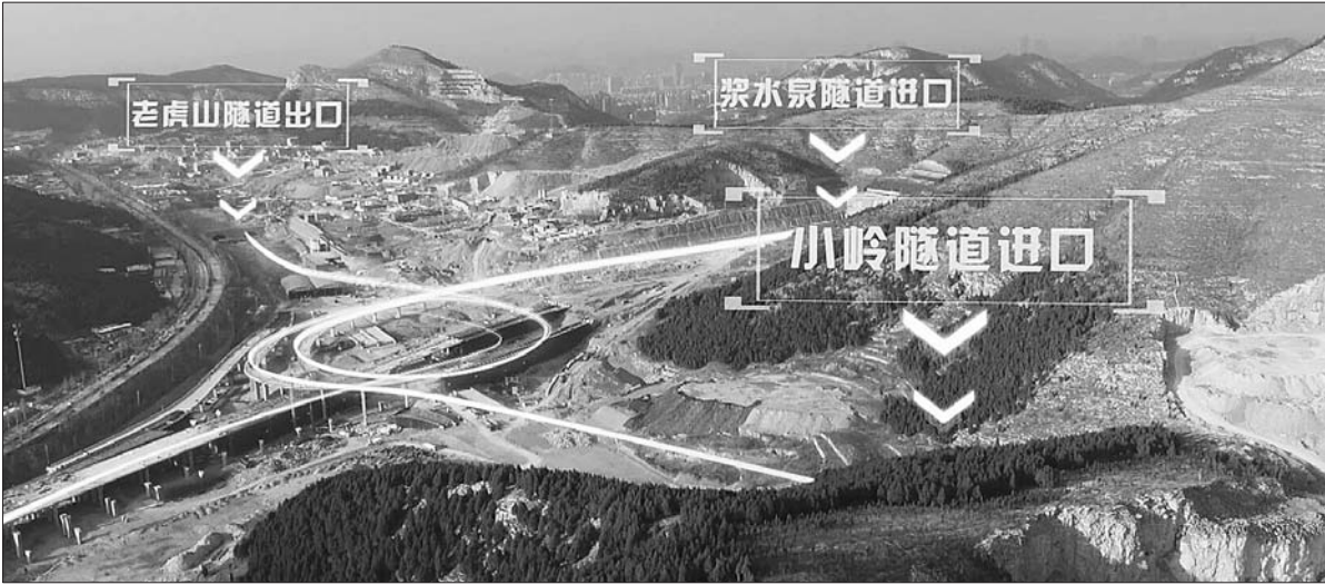
搬倒井立交起到了互连互通的作用。

全线6条隧道已全部提前实现双洞安全贯通,为工程年底通车提供了保障。目前已进入工程攻坚阶段,各参建单位正强化管理,全力推进工程进度。二环东南快速路延长线工程是城区东南部两条交通要道,对完善快速路网体系,缓解城区交通拥堵,扩展城市发展空间具有重要意义。