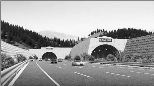
老虎山隧道效果图。