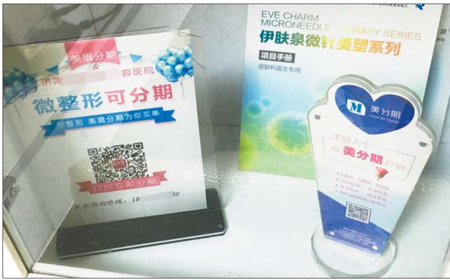
济南一家美容整形医院里,摆着多个贷款平台的二维码。