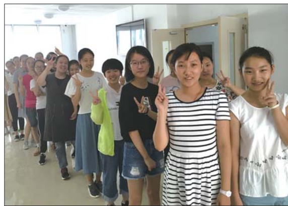
要开始独立生活了,孩子们加油。