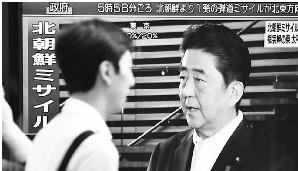
8月29日,东京,巨型显示屏显示着日本首相安倍晋三(右)就朝鲜导弹飞越日本列岛事件发表讲话。

韩国媒体称,这是朝鲜继上周末发射3枚短程弹道导弹后再次进行“挑衅”,结束了美国官员描述为“克制”、时长一个月的间歇期。据日方判断,朝鲜试射的正是此前宣称要用于对关岛实施包围打击的“火星12”新型导弹。