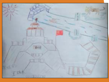
济南市历城实验小学 2016级7班 王烁杰