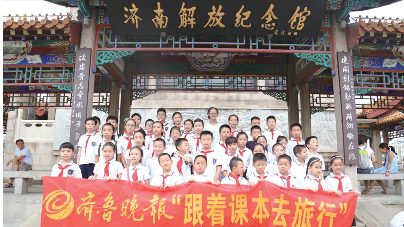
“跟着课本去旅行·走进老济南”第七期探访济南解放阁，游览黑虎泉泉群。