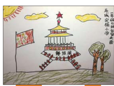
济南市历城实验小学 2016级7班 高天雨

师的介绍下,我终于知道解放阁是济南战役的纪念馆,我们仔细听导游老师的讲解,并观察了里面陈列的物品,不仅有衣服、水壶、旗帜等,还有很多牺牲战士的名字,看了之后我很震撼。这次活动让我更加懂得没有革命先辈的牺牲就没有我们现在的美好生活。我会好好珍惜今天的幸福生活,好好学习,长大后为我们的国家做出贡献。