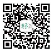
扫码关注“老乔游记”微信订阅号

接下来,齐鲁晚报旅游工作室仍将不定期组织研学游、周末游、亲子游等活动,请您关注。通过订阅“老乔游记”微信公众号,可获取更多及时信息。