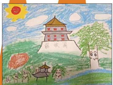
济南市历城实验小学 2016级7班 韩兆阳