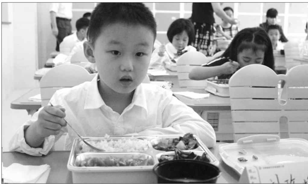
开学第一天,高新区东城逸家小学200多名学生在校吃午餐。

■市中、历下、历城三区主要采取社会小饭桌服务加学校配餐的方式,满足就餐学生的需求。