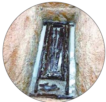
黄岛区土山屯墓群中一座被发掘的墓葬。(资料片)