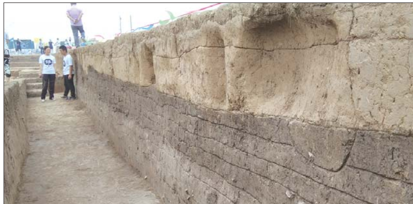
焦家遗址发掘的一条壕沟。(资料片)

该墓地的发掘是我省近年来汉代考古的重要发现。其公文木牍是我省首次发现该类实物资料,木牍内容详尽,文字清晰,书法工整,是研究秦汉史的珍贵实物资料。