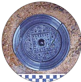
黄岛区土山屯墓群中出土的文物。(资料片)