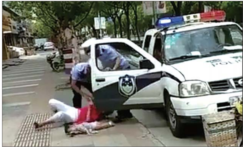
女子和幼童被摺倒的瞬间。(视频截图)