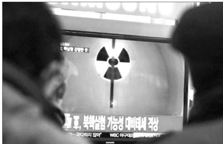
韩国民众在观看朝鲜核试验报道(资料片)。

韩国国防部长官宋永武8月30日与美国国防部长马蒂斯在华盛顿举行会晤。韩联社8月31日报道称,两人谈及在韩部署战术核武器和核潜艇问题,引发高度关注。不过,韩国政府高官9月1日辟谣称:韩国无意让核武器重回朝鲜半岛,所谓“谈及核武器”要放在特定语境中理解。