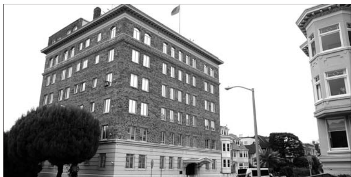
俄罗斯驻旧金山总领馆。

分析人士认为,美方对俄采取的最新姿态意味着两国外交战的延续,这一事件将为美俄关系蒙上阴影,两国关系短期内难转暖。