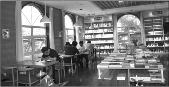
日照植物园城市书房。

9月1日是日照市中小学开学日,此处城市书房成为开学大礼,为老城区少年儿童提供了新