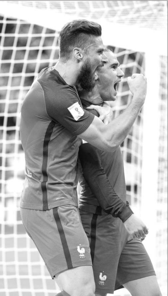
世预赛一场法国大胜荷兰更让外界看到了新陈代谢的重要性。

北京时间9月2日凌晨，世界杯欧洲区预选赛继续点燃战火，传统强队纷纷取得胜利，英格兰4:0大胜马耳他，德国2:1绝杀实力不弱的捷克，各自在小组中领跑，明年去俄罗斯，看来已经只是时间问题了。在送走了黄金一代后，三狮军团反而迎来了属于自己的春天。