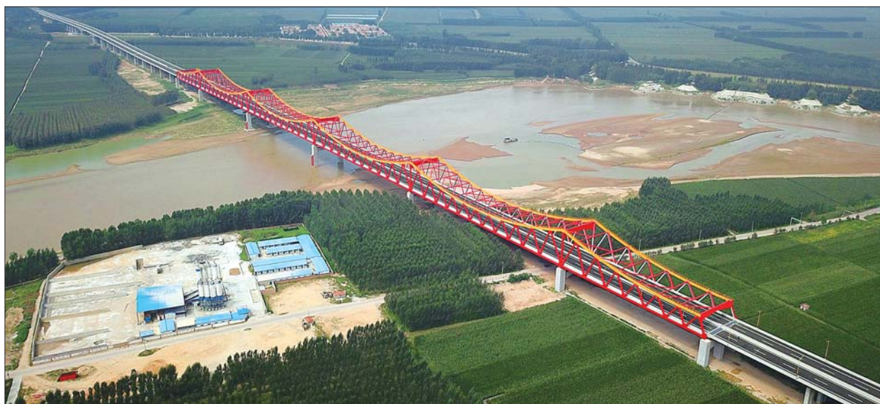
大桥像一道长虹飞架黄河。

本报9月8日讯(记者 刘飞跃) 8日,位于长清区西端的济南长清黄河公路大桥工程实现交工验收,意味着济南通往德州、聊城的“西南大门”跨黄河通道将由此畅通。大桥建成后,将会形成一条从济南西部跨越黄河的交通大通道,对促进省会城市群融合发展起到积极助推作用。