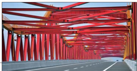
大桥甚是雄伟壮观。