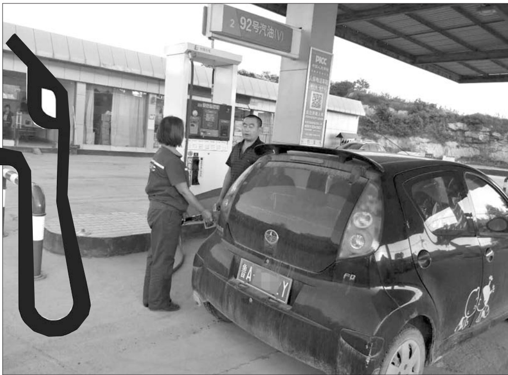
作为试点城市的济南,加油站里已基本见不到乙醇汽油。

近日,国家发展改革委、国家能源局、财政部等十五部委联合印发《关于扩大生物燃料乙醇生产和推广使用车用乙醇汽油的实施方案》,明确在全国范围内推广使用车用乙醇汽油,到2020年基本实现全覆盖。