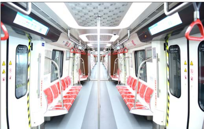
青岛地铁2号线车厢内景。

每两分钟就跑完一站路,可与3号线同站台无缝隙换乘,车厢清新风格更靓……14日上午,记者亲身体验青岛地铁2号线东段,清新靓丽的车厢和嗖嗖的速度都让人充满了期待,年底前2号线东段将载客,届时青岛将进入轨道交通换乘时代。