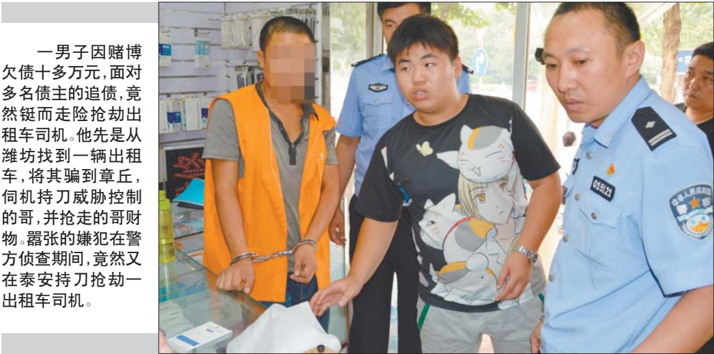
一男子因赌博欠债十多万元,面对多名债主的追债,竟然铤而走险抢劫出租车司机。他先是从潍坊找到一辆出租车,将其骗到章丘,伺机持刀威胁控制的哥,并抢走的哥财物。嚣张的嫌犯在警方侦查期间,竟然又在泰安持刀抢劫一出租车司机。