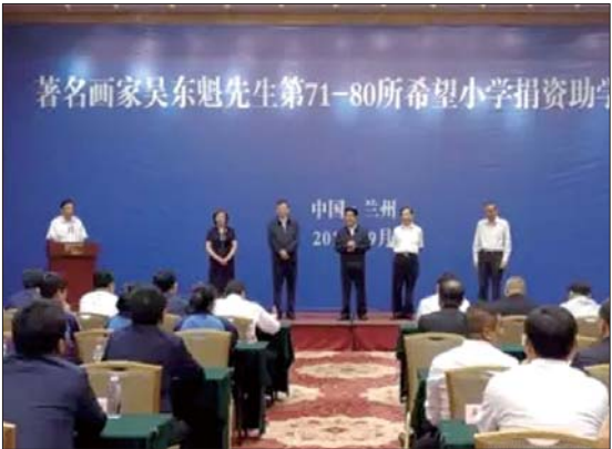
著名画家吴东魁第71—80所希望小学捐助现场。