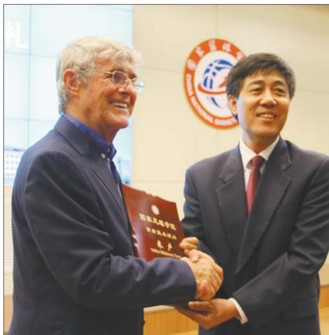
米卢受聘国家足球学院首席技术顾问，出席国家足球学院、国家篮球学院首届新生开学典礼。