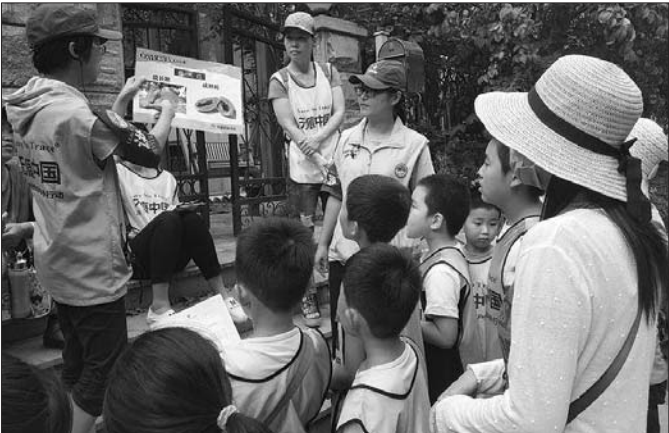
自然课堂让青少年仔细关注身边的事物。

本报9月24日讯(记者 张九龙) 您是否为孩子课业负担沉重、没有机会亲近自然而担忧?9月23日下午,“风孩子”自然课堂正式开课,今后两个月里,社区青少年们有机会走出家门,认识自然,接触自然、亲近自然、爱护自然。 此次活动由历下区千佛山街道历山名郡社区居委会、齐鲁晚报张刚大篷车及“无痕中国”“全民瑜伽”等公益组织共同举办,将以体验式课堂的形式,培养社区青少年的观察能力,增强其环保意识。